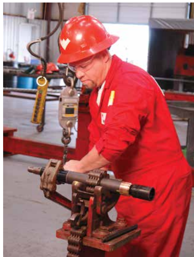
Рисунок 2 – Двигатель CTD® компании Weatherford остается одним из самых надежных промышленных забойных двигателей на рынке

Используя эту и другие технологии, Weatherford помогает добывающим компаниям по всему миру и в России повышать дебит и продлевать срок эксплуатации скважин. ©