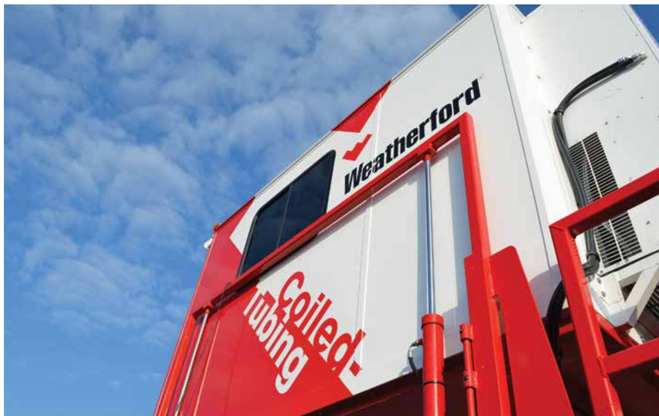
Рисунок 1 – Внутрискважинные работы через ГНКТ стали для компании Weatherford важным бизнес-сегментом Figure 1 – Coiled-tubing has become a significant segment of Weatherford's business

перфорированных интервалов за одну СПО на гибких НКТ.